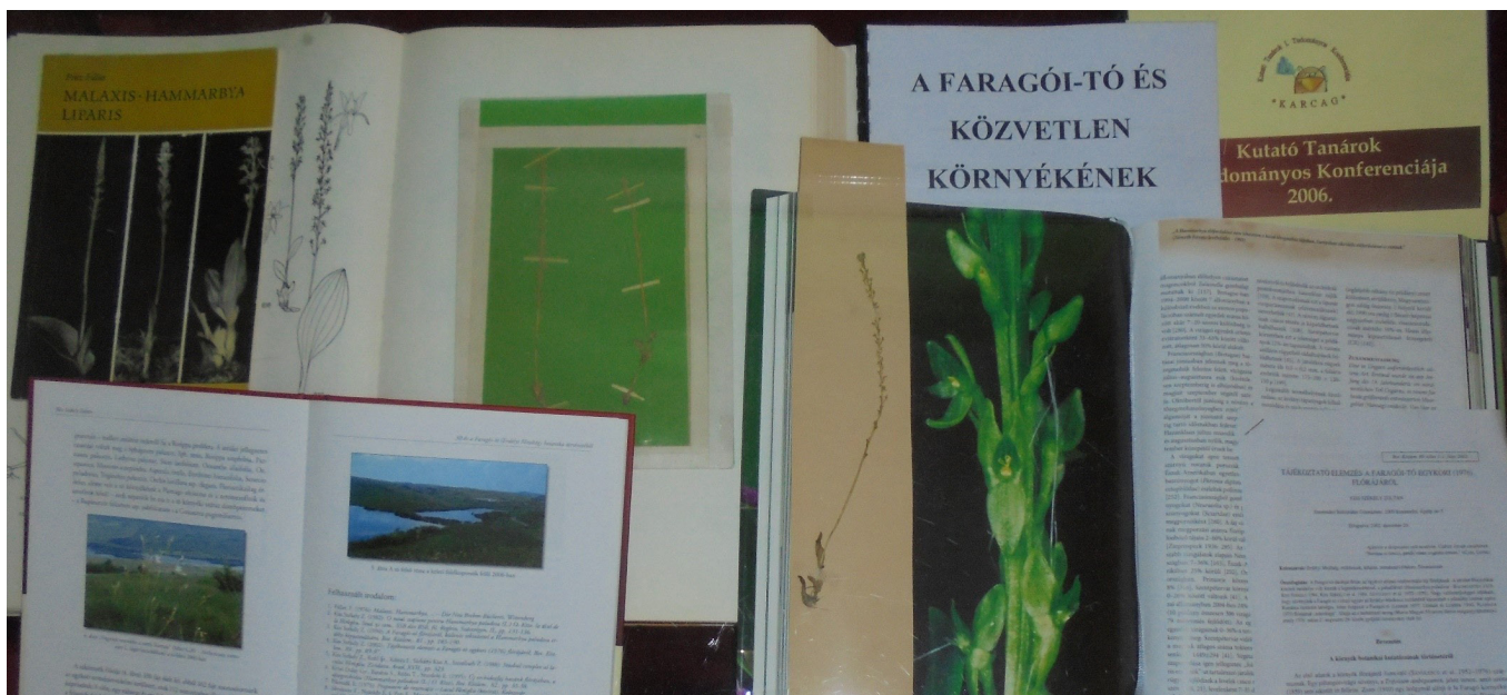
Hammarbya paludosa (L.) O. Kuntze – puhafű, tőzegorchidea

A hónap természettudományos múzeumi tárgy 2018. január