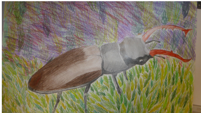
Osváth Míra 11. b