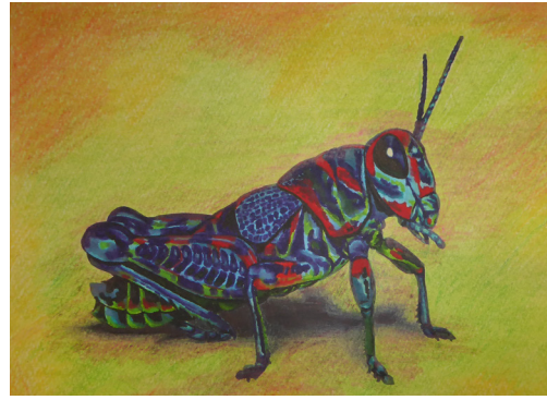
Tirol Zsófia 11.a

Az este az emlékeké: már mind távolabb a földtől, lábujjhegyen elrugaszkodva, s kezdődik minden – máshol – előlről.