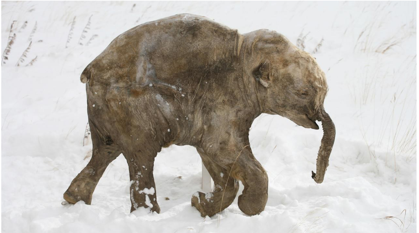
Mammuthus primigenius fraasi Dietrich – mamut – a jégbe fagyott Ljuba mamutbébi